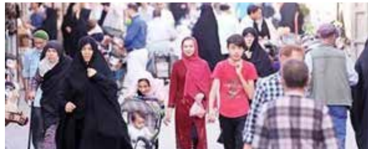
چهارشنبه به درگاه باری تعالی به جان اوردن پناهانه بر جوان جوان حسین به نان ایرد. چه بر ما رفته است با این تاریخ و فرهنگ و ادب و عرفانی که داریم اینچنین شدیم؟

امروز برخوردهای مهاجر ستیزانه و بطور مشخص افغان ستیزانه بدنبال توجیه و فرار از توضیح علل بیکاری، فساد و دزدی و بزه کاری و قتل و ناهنجاری‌های اجتماعی در ایران است. در ممالک اروپایی نیز علل بحران اقتصادی و افزایش خشونت‌های اجتماعی را به گردن مهاجران می‌اندازند و نه نظام سرمایه‌داری. در مقابل این سیاست ارتجاعی و نژاد پرستانه و تبعیض‌آمیز باید ایستاد و با پناهندگان ابراز همبستگی کرد و از حقوقشان حمایت نمود. در ایران نیز وظیفه نیروهای آگاه و مردمی است که در مقابل سیاست نفرت‌انگیز افغان‌ستیزی بایستند و پرچم همبستگی و برابری را برافراشند.*